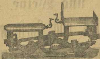
Eisenteller und Quadrat mit Gitter.