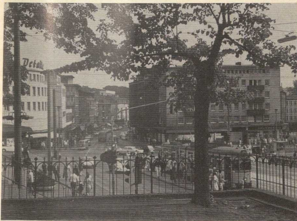
Blick von der Johanniskirche auf die Hauptstraße und den Rathausvorplatz

Daß Wittens 108.000 Einwohnern rund 72 Quadratkilometer Stadtgebiet zur Verfügung stehen, ist trockene Statistik. Lebendig werden diese Zahlen, wenn man genauer hinsieht. Nur ein Drittel dieser Fläche ist bebaut mit Häusern, Betrieben, Straßen. Zwei Drittel