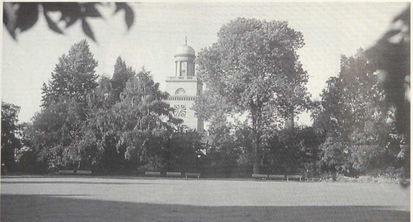
Blick auf das Rathaus vom Lutherpark aus