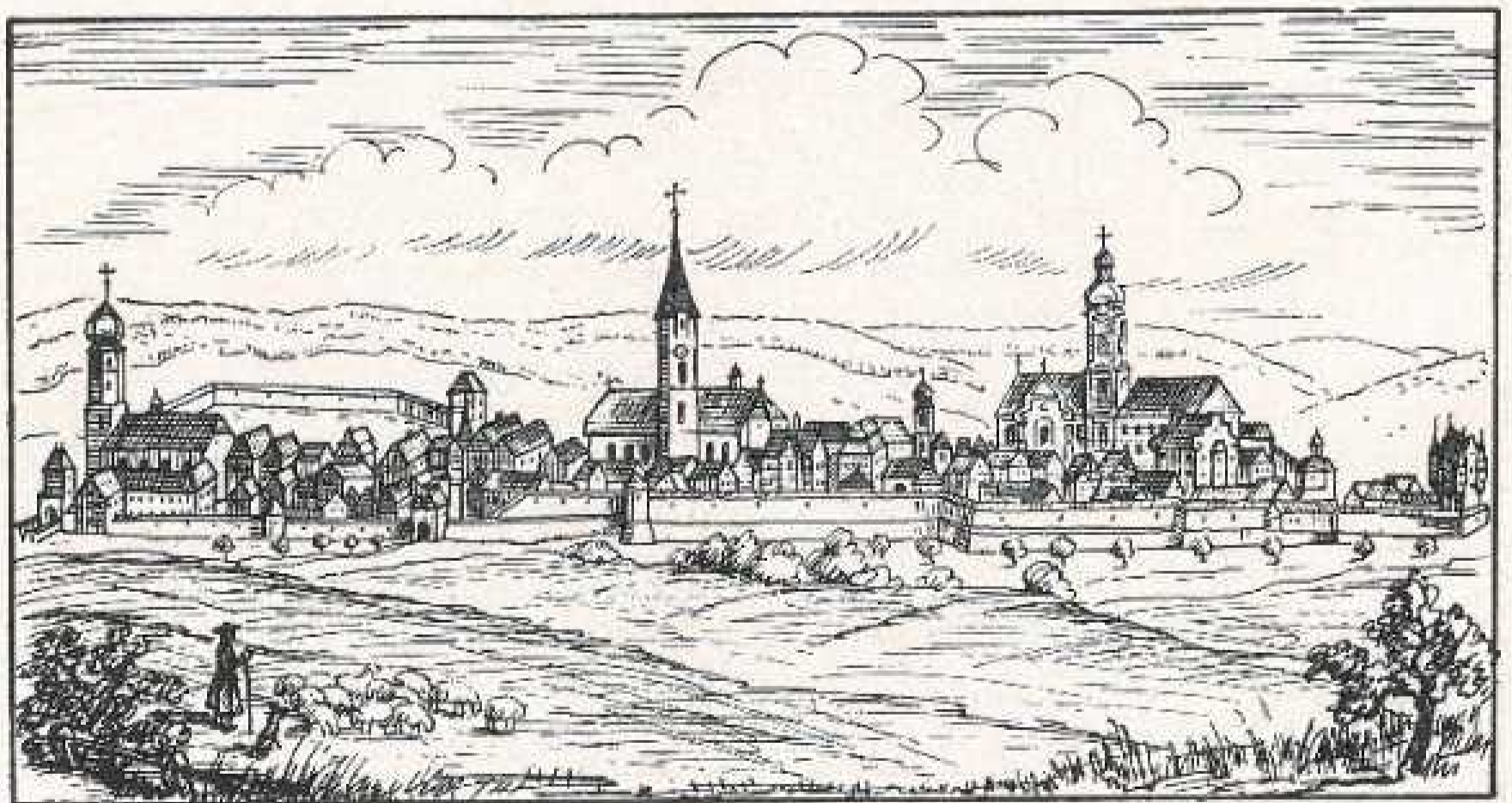
Ehingen im 18. Jahrhundert

In Blaubeuren besuchen Sie das Kaffee Straub • Fernruf 300