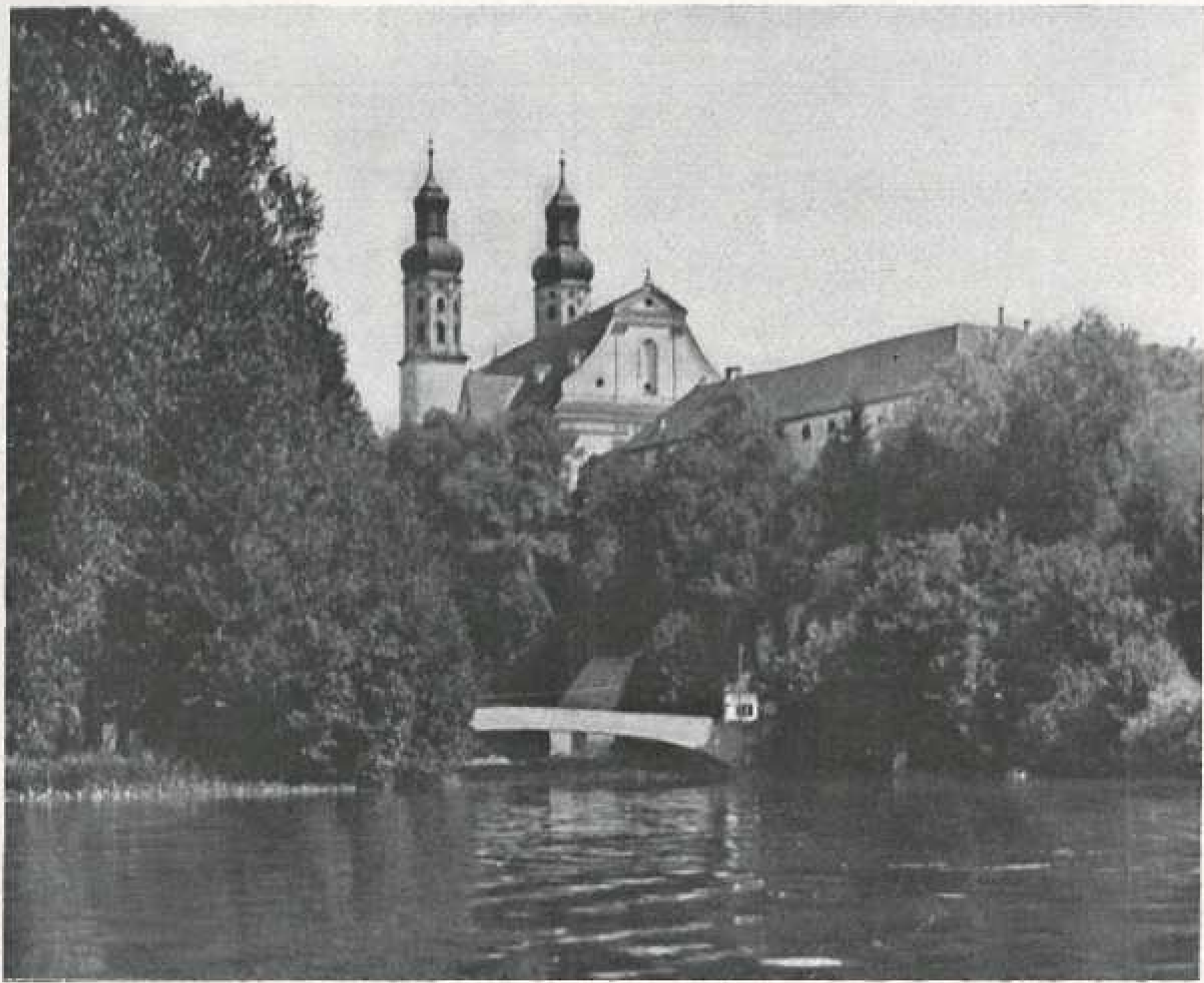
Schloß und Kirche in Obermarchtal hoch über der Donau gelegen, eine der großartigsten Bauten in Oberschwaben