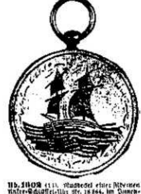
11. 1309. ...