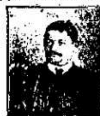
11. 1744. ...