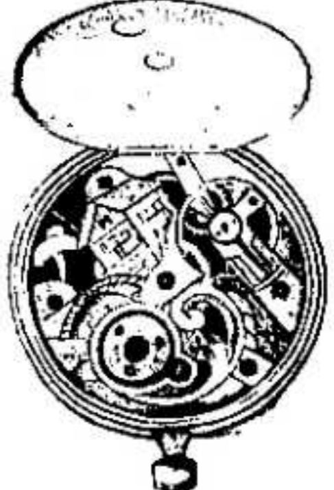
11. 1314. ...