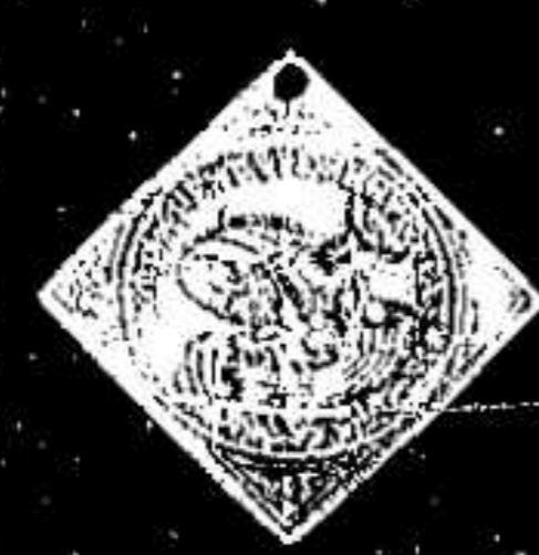
11. 1304. ...