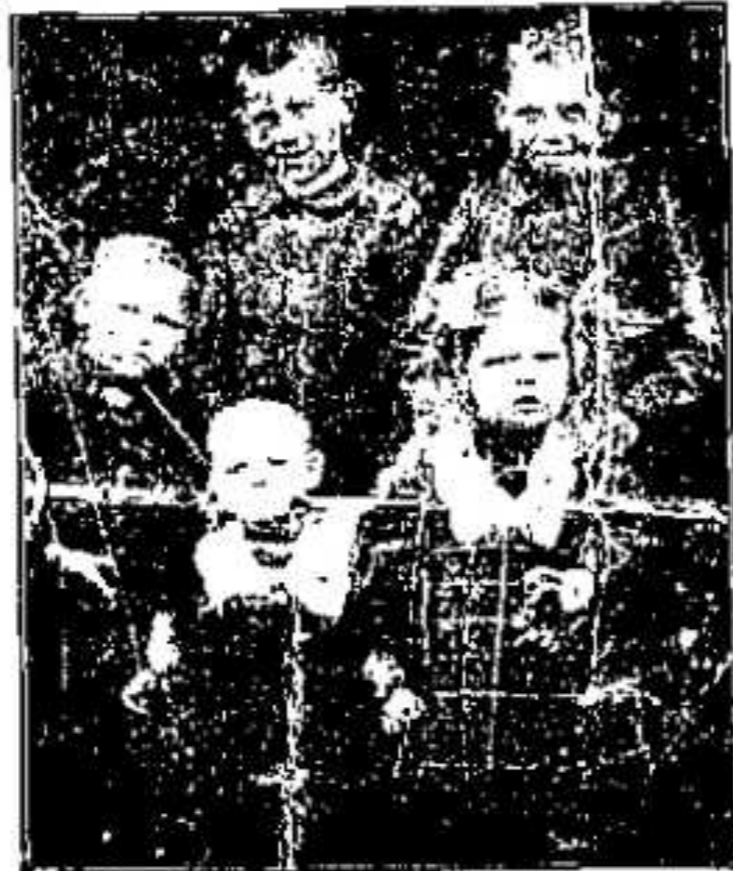
11. 1329. Familienaufnahme aus einem ...