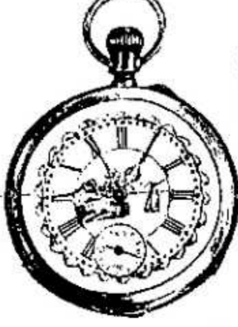
11. 1311. ...