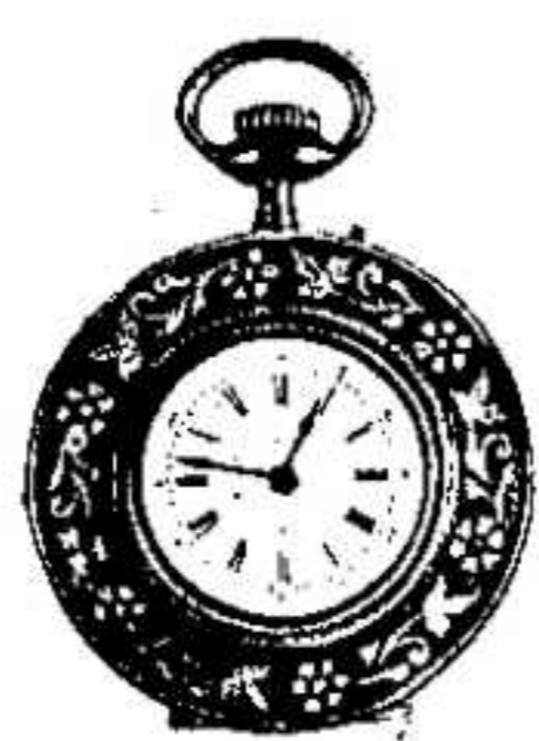
11. 1444. ...