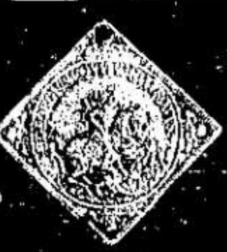
11. 1304. ...