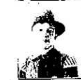
11. 1327. ...