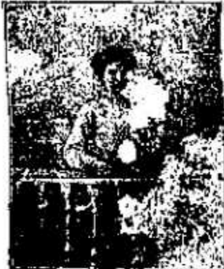
11. 1445. ...