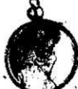
11. 1781. ...