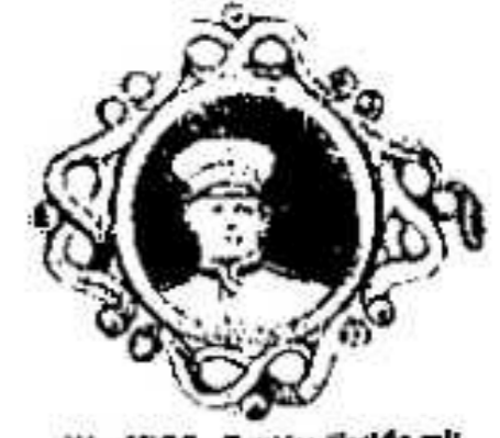
11. 1306. ...