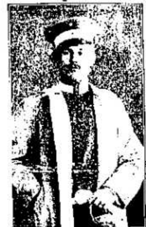
11. 1319. ...