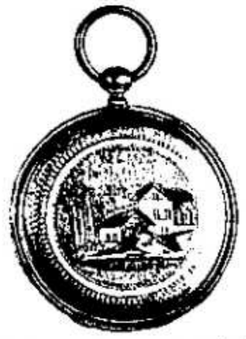
11. 1442. ...