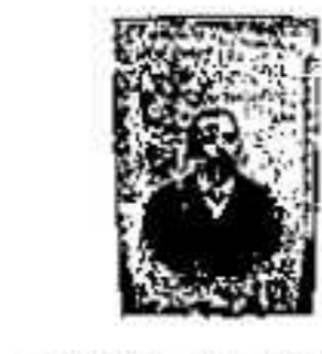
11. 1321. ...