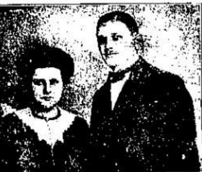
11. 1325. ...