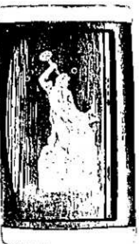
11. 1325. ...