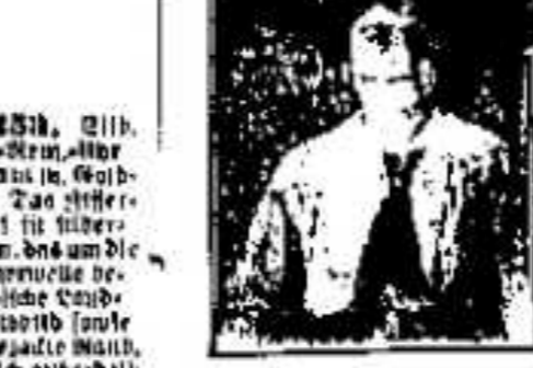
11. 1311. ...