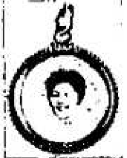
Nr. 2177. Zwei Frauen...