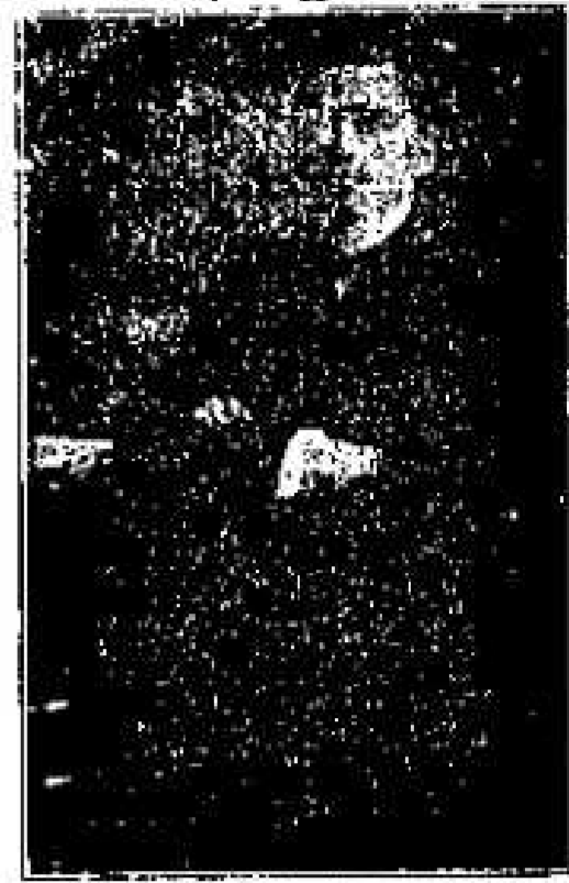
Nr. 2157. Verheiratete Doktorin...