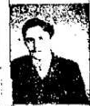
Nr. 2147. Zwei Frauen...