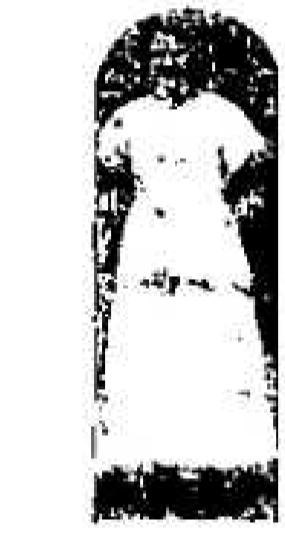
Nr. 2117. Eine Frau...