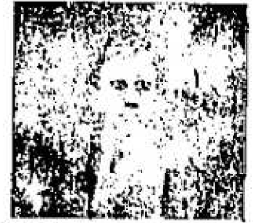
Nr. 2117. Zwei Frauen...