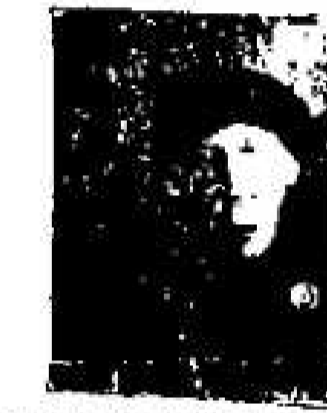
Nr. 2101. Eine Frau...