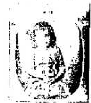
Nr. 2157. Zwei Monate alte eines Kindes...