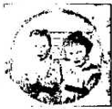
Nr. 2158. Zwei Frauen...